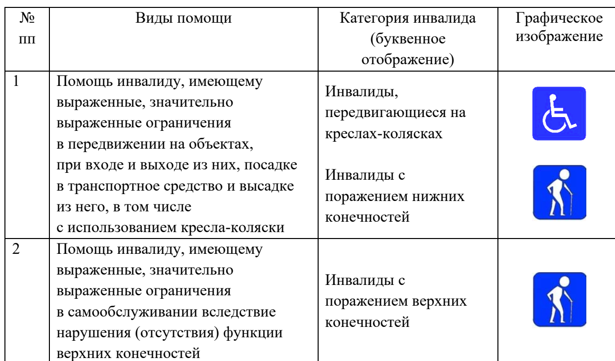
Таблица 1 – Виды помощи, в которых нуждается инвалид (ребенок-инвалид) для преодоления барьеров, препятствующих ему в получении услуг на объектах

Приказом Минтруда России от 13.06.2017 № 486н «Об утверждении Порядка разработки и реализации индивидуальной программы реабилитации или абилитации инвалида, индивидуальной программы реабилитации или абилитации ребенка-инвалида, выдаваемых федеральными государственными учреждениями медико-социальной экспертизы, и их форм» определены виды помощи, в которых нуждается инвалид (ребенок-инвалид). Виды помощи для преодоления барьеров, препятствующих ему в получении услуг на объектах, представлены в таблице 1.